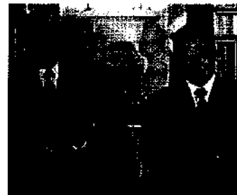
Die Menschenrechte sind in festen Händen

Vereinigungen. Viele davon wurden künstlich geschaffen, um ein Gegengewicht gegen tatsächlich unabhängige NROs zu bilden. Eine Vielzahl von professionellen, sozialen oder karitativen Vereinigungen war ursprünglich spontan innerhalb der Gesellschaft entstanden. Das Regime brachte sie jedoch unter seine Kontrolle, indem es ihm treu ergebene Mitglieder auf Spitzenpositionen setzte. Die Belohnung hierfür war ihre Legalisierung durch das Innenministerium. Dieses nutzt die Erteilung der Zulassung als ein Einmischungsrecht in die Zusammensetzung der Leitung der Vereinigungen, wenn diese in den Verdacht geraten, zu selbständig zu agieren. 0